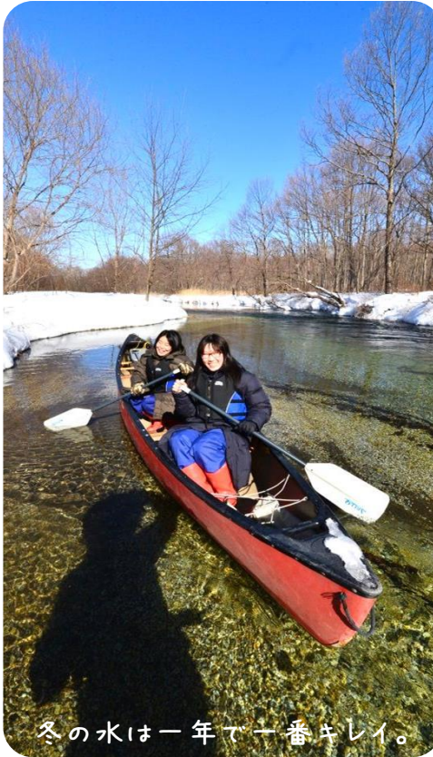
冬の水は一年で一番キレイ。