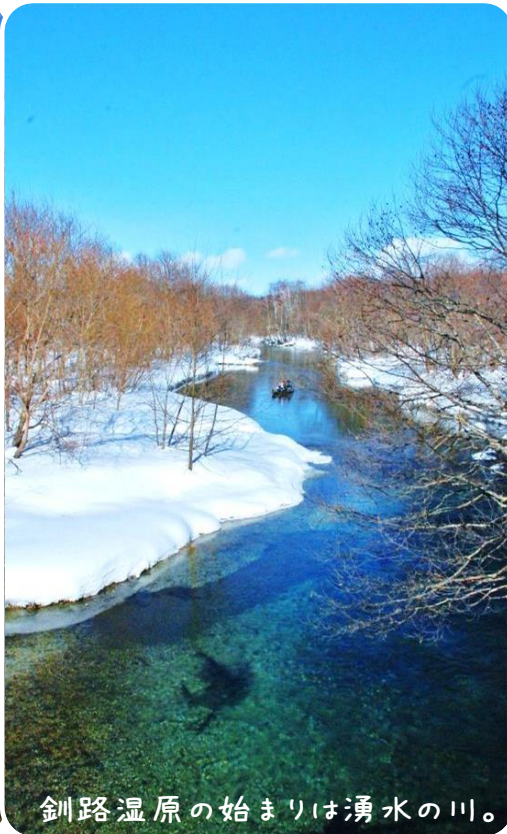
釧路湿原の始まりは湧水の川。